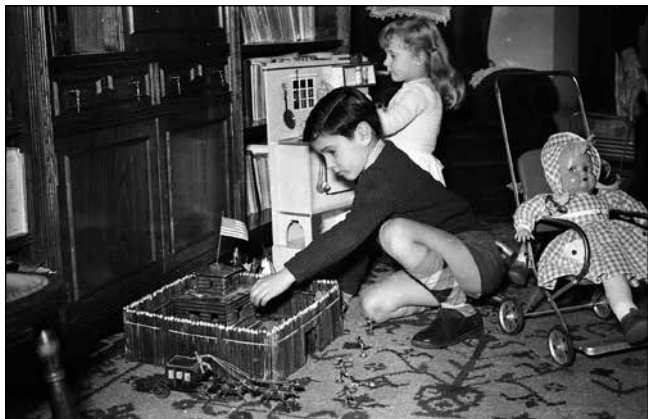
Muséu del Pueblu de Asturias Gijón/Xixón.

de tres en tres. Tertulia fotográfica Raw2. Sala de exposiciones.